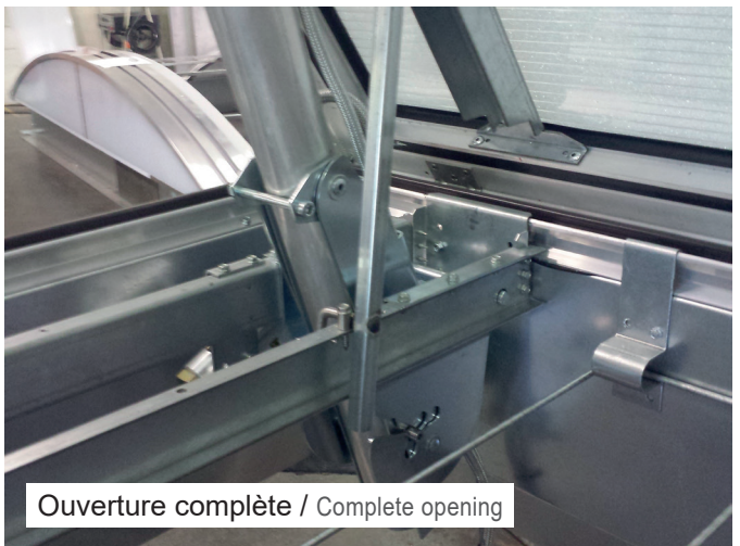
Ouverture complète / Complete opening

L'appareil est ouvert vous pouvez maintenant accéder à la toiture The device is open, you can reach the roof now