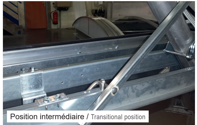
Position intermédiaire / Transitional position