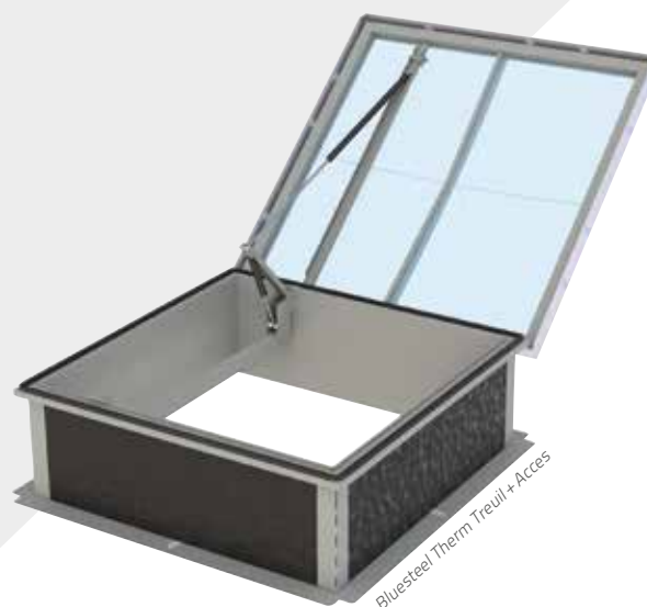
Bluesteel Therm Treuil + Accès