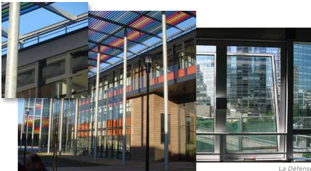
CCI (bâtiment de formation) - Le Mans © ARCHITOUR - Architectes Associés Philippe Rousseau