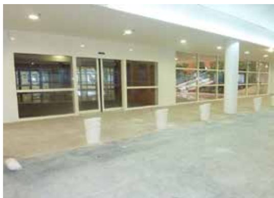
E Leclerc - Bourg-en-Bresse (01)