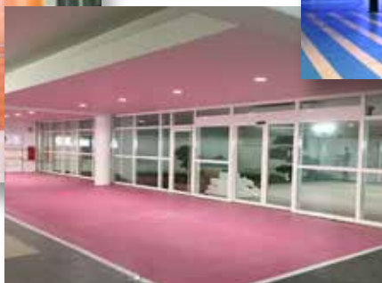
E. Leclerc - Bayeux (14)