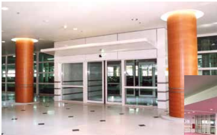
Centre commercial ATLANTIS - Nantes (44) Porte vitrée coulissante DOORGLASS