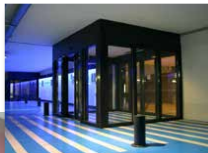
CC Les Passages Boulogne Billancourt (92)