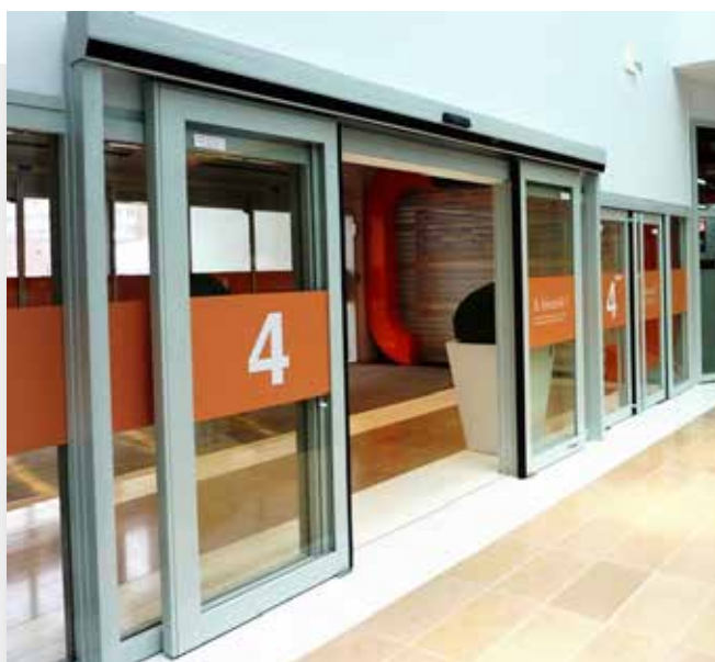
Tour Oxygène - Lyon (69)

Parfaitement compatibles avec les différents types de cloisons EMV et EMV Horizon , les portes coupe-feu vitrées coulissantes DOORGLASS sont adaptées à la circulation des personnes, à ouverture et fermeture automatiques et déclinables en un ou 2 vantaux égaux .