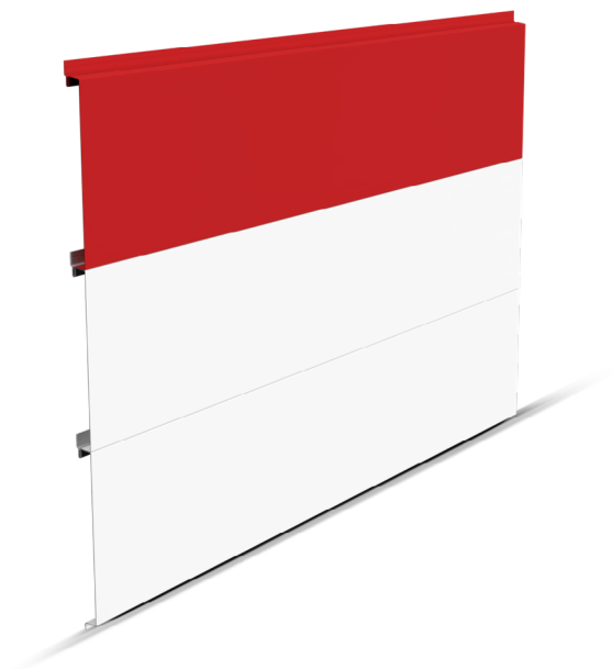
Teklame Lila, coloris RAL 3000 &amp; 9010

Fabriquée grâce à un procédé de profilage breveté par le CSTB, la Teklame Lila garantit une planéité parfaite de votre façade. Son mode de production permet de réaliser des lames de grandes longueurs et d'assurer une capacité de production élevée (jusqu'à 2500 m 2 par semaine). L'espacement des supports porteurs tous les 2 mètres permet une mise en œuvre simple et rapide.