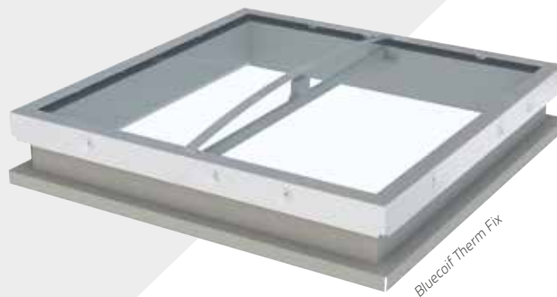
Bluecoif Therm Fix