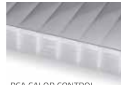
PCA CALOR CONTROL