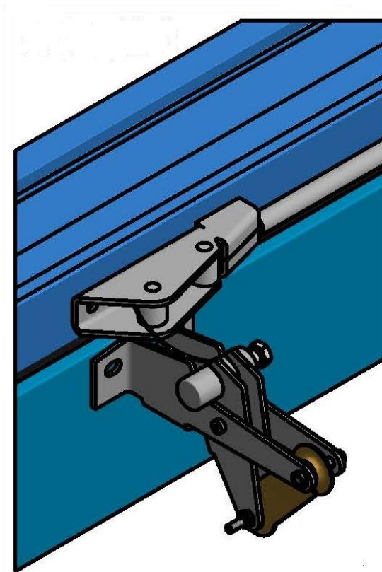
Schéma du col de cygne pour châssis ouvrant vers l'intérieur