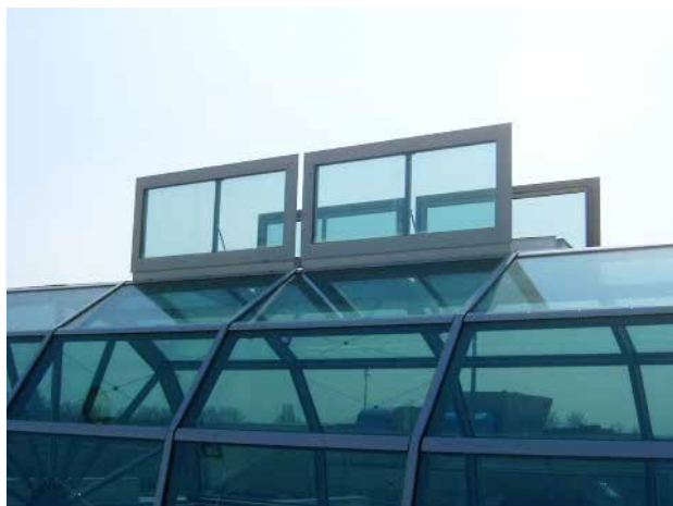
Centre commercial Carrefour (Quétigny)