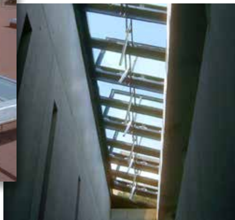
IUFM - Strasbourg © Architecte X