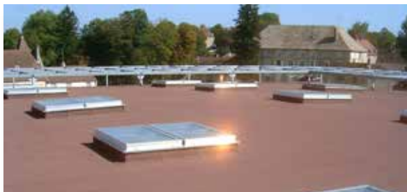
La Commanderie - Dole © Architecte X