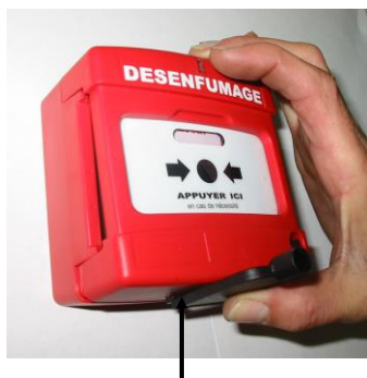
Outil pour le déverrouillage du capot (Utilisé également pour le réarmement)