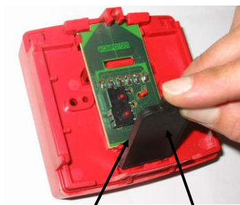
Ergots pour le démontage du bouton