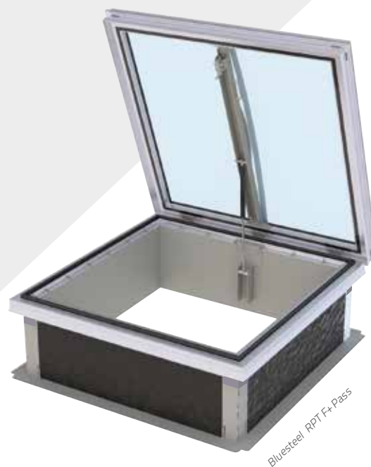
Bluesteel RPT F+ Pass