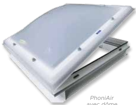
PhoniAir avec dôme