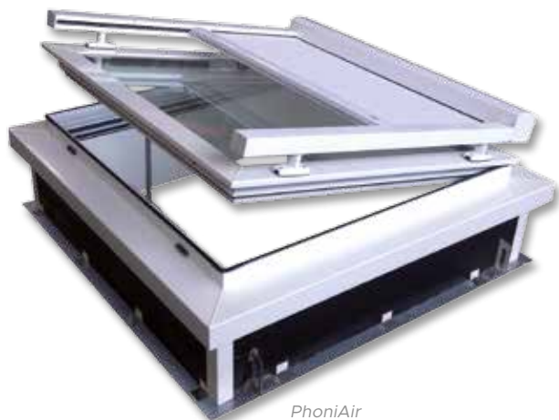
PhoniAir avec store mobile d'occultation