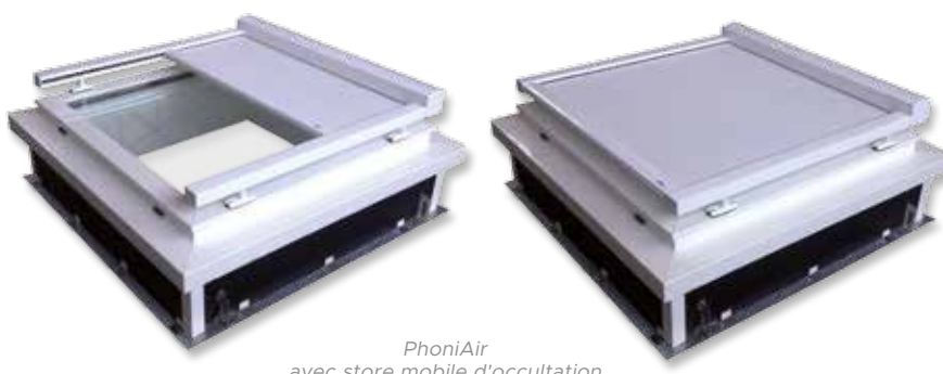
PhoniAir avec store mobile d'occultation