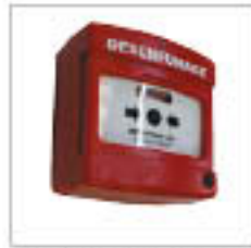
Organe de sécurité à manipuler avec voyant pour SADAP 06075-1