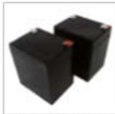
Jeu de batteries pour SADAP 00001-0