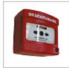
Organe de sécurité à manipuler sans voyant pour SADAP 06075-0A