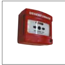
Organe de sécurité à manipuler sans voyant pour SADAP 06075-0A