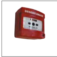
Organe de sécurité à manipuler avec voyant pour SADAP 06075-1