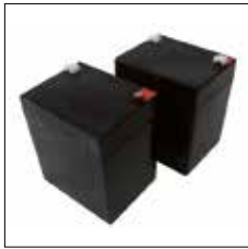
Jeu de batteries pour SADAP 09001-0