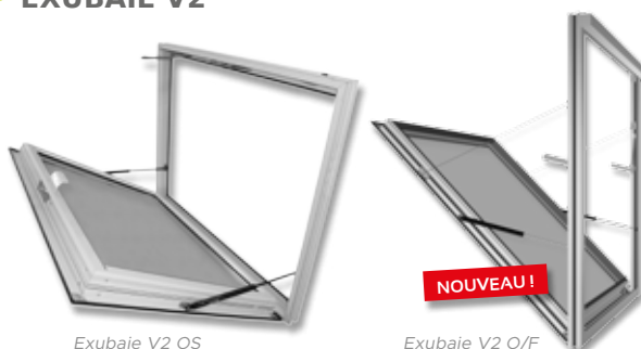
Exubaie V2 OS