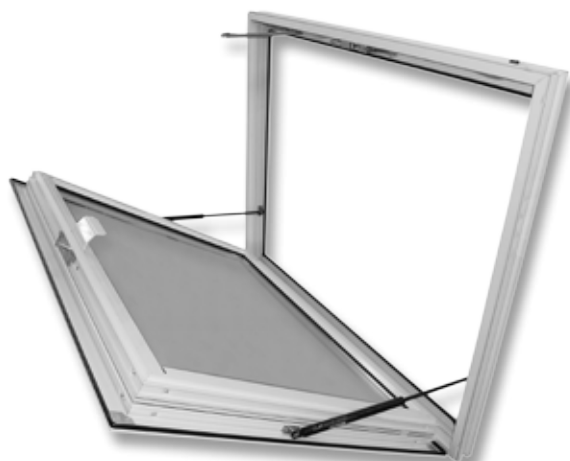
Exubaie V2 OS