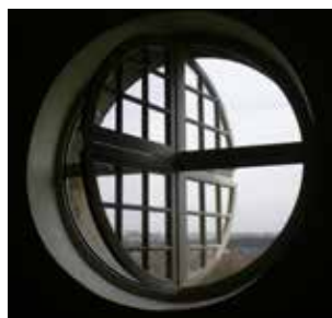
Château de Vincennes

La solution de désenfumage adaptée aux Monuments Historiques, respectant architecture et menuiseries existantes .