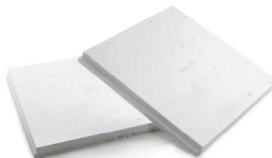
Verlegeschema A: mit flapor-Gefälledämmplatten