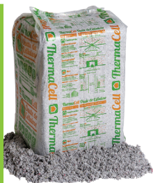
ThermaCell Ouate de cellulose