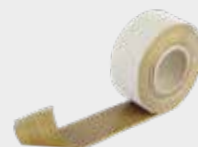
TECSOUND® S50 BAND 50