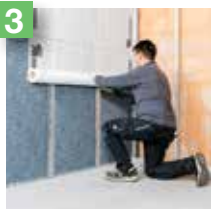
3 Pose du pare-vapeur.