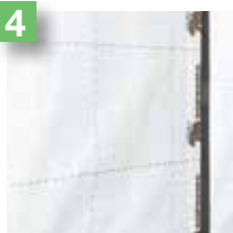
4 Fixation du pare-vapeur avec un adhésif double-face, création d'un vide technique puis pose des plaques de parement.