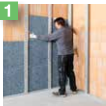
1 Pose de la première couche d'isolant.