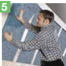
5 Se pose également en rampants de combles.