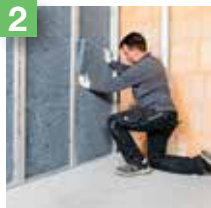
2 Pose de la seconde couche d'isolant.